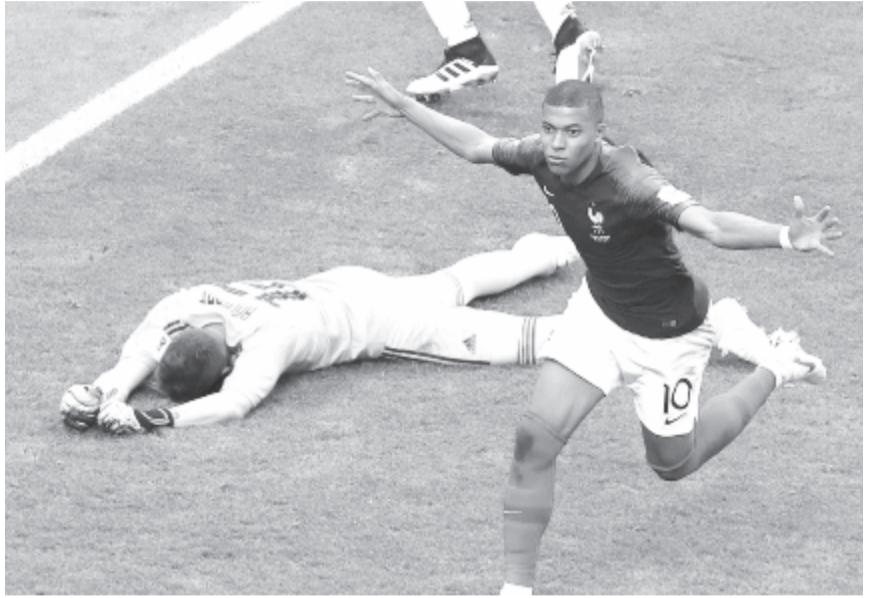
Kylian Mbappé megindulásaival nem tudott mit kezdeni az argentin védelem, a francia támadó kettőt válogott a dél-amerikaiaknak

A fordulás után Ever Banega szerencsés góljával szinte azonnal megszerezte a vezetést Argentína, de a gallok Benjamin Pavard bombagóljával tíz percnél belül egyenlítették, majd Kylian Mbappé